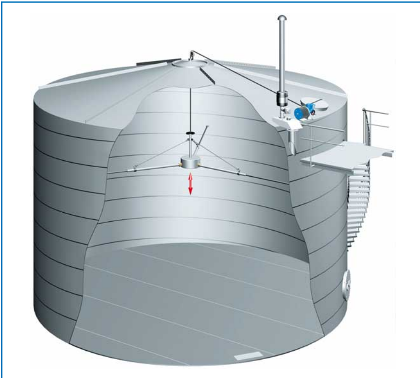
Abb. 4: Die Reinigungseinrichtung besteht aus einem zentrisch angeordneten Drehverteiler, an dem die Strahlrohre befestigt sind.

Die Grundlagen der modernen Wasserversorgung legten bereits die Römer. Holz und Tonrohre überdauerten Jahrhunderte. Mitte bis Ende des 19. Jahrhunderts wurden Stahl- und Gussrohre eingesetzt und die ersten Behälter in Stampfbeton gebaut. Der zunehmende Wasserverbrauch erforderte immer größere Behälter, welche in Spannbetonbauweise errichtet wurden. Bei den Ausrüstungsteilen wurde allerdings bereits vor Jahrzehnten immer mehr Edelstahl bevorzugt. Korrosion sowie unsachgemäße Verarbeitung und mangelhafte Baustoffe führten und führen zu einem stetigen und enormen Sanierungsbedarf. Wasserspeichersysteme mit Edelstahlbehältern unterbrechen diese Kette und sind damit der innovative Weg für die Zukunft.