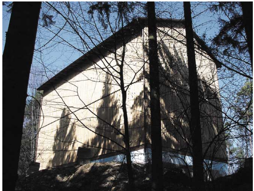
Abb. 1: In diesem Gebäude aus Holz steht in Wüstenstein eine Behälteranlage mit zwei Tanks und 700 Kubikmeter Trinkwasser.

Dazu kam der Wille, eine qualitativ äußerst hochwertige, aber dennoch kostenoptimierte Systemlösung zu entwickeln.