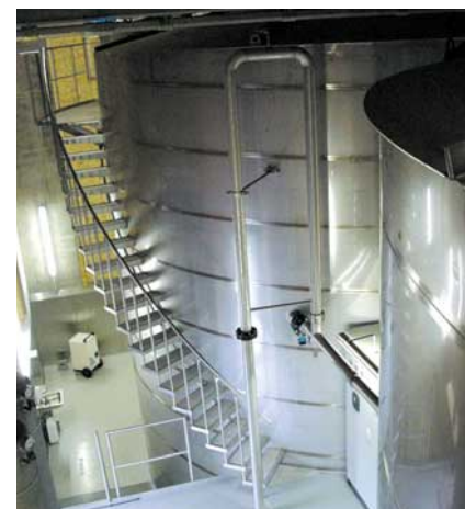
Abb. 3: Über freitragende Bogentreppen werden die Bedienpodeste im oberen Behälterbereich erreicht.

Dem Objektschutz kommt im Bereich der Wasserversorgung eine große Rolle zu.